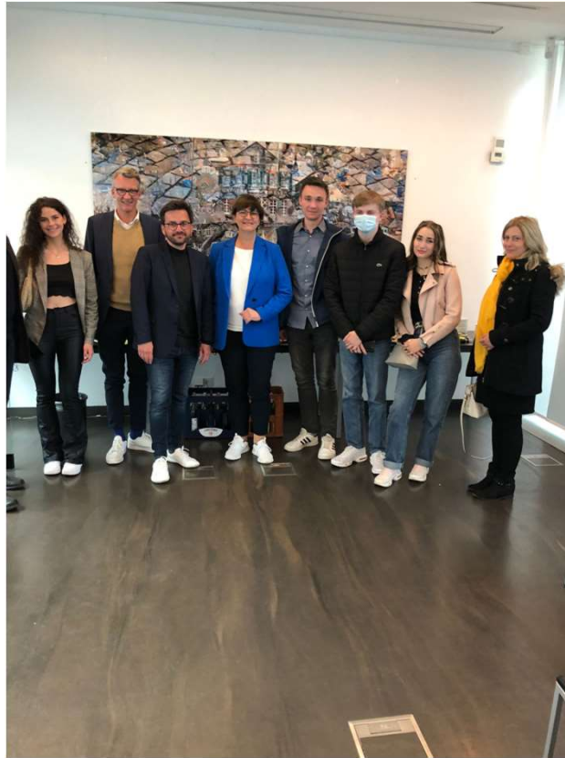
Saskia Esken und Thomas Kutschaty zu Besuch in Remscheid!